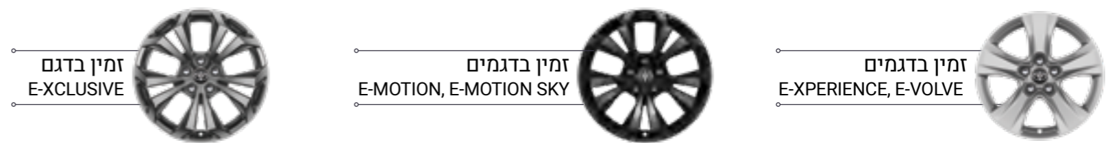
זמין בדגם E-XCLUSIVE

* מנגנון "בעיטה" אינו פעיל בהתקנת וו גרירה