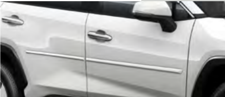
סט פסי הגנה לדלתות בצבע הרכב המספקים שכבת הגנה לדלתות מפני שריטות ופגיעות קוסמטיות