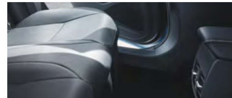
פתחי מיזוג אחוריים ליושבים במושב האחורי