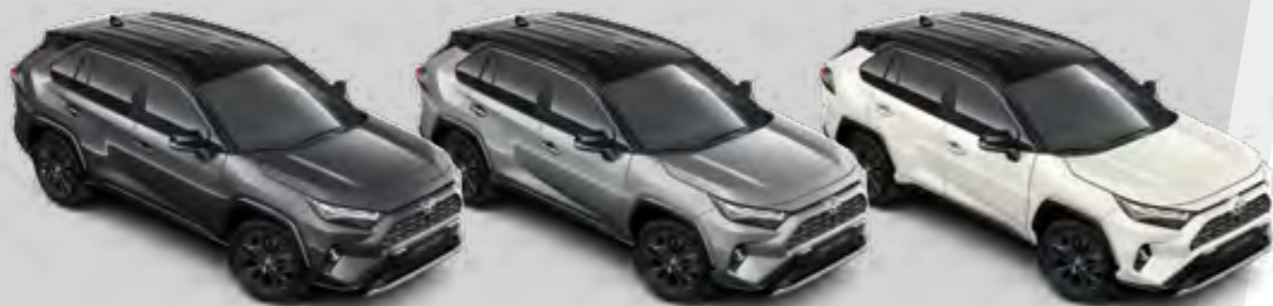
2QZ - אפור כהה (1G3) / שחור (218)