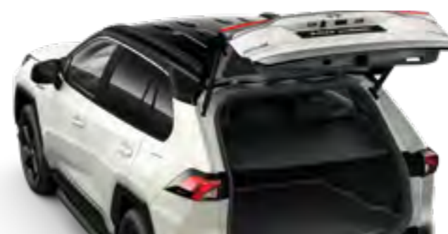
דלת תא מטען חשמלית*