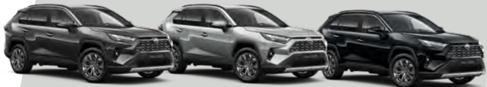
אפור כהה מטאלי 1G3