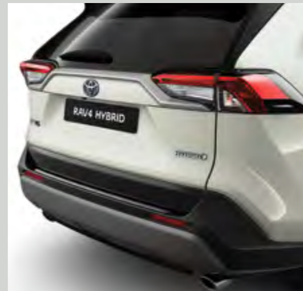
מגן פגוש בעל מראה מתכתי מבריק המגן על הפגוש בעת טעינה ופריקה של סחורה מתא המטען