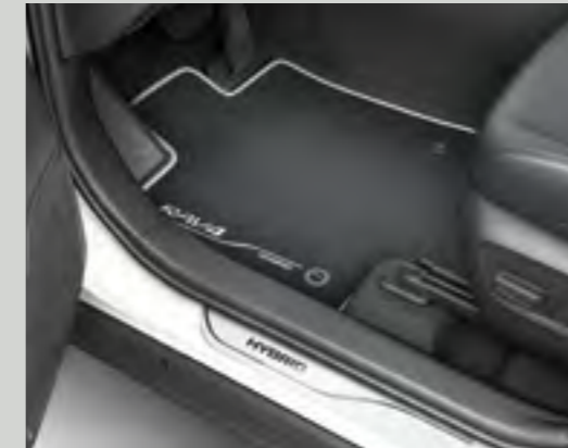
סט קישוטי סף מקוריים המותאמים לסף הדלת היוצרים רושם מידי של סטייל ומשמשים להגנה מפני לכלוך ושריטות