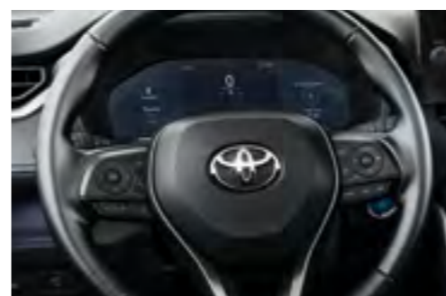
צג נתונים דיגיטלי מלא 12.3"*