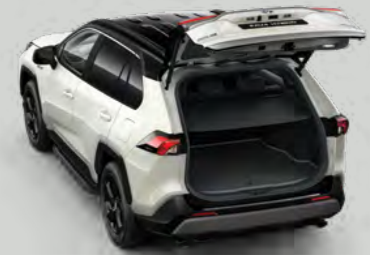
אמבטיה לתא המטען המספקת הגנה מפני לכלוך ומפני החלקה של ציוד וסחורה