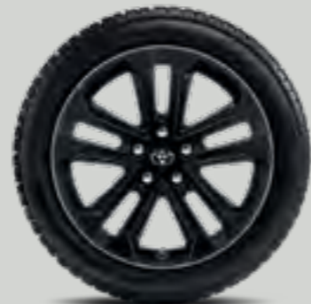
ערכת גלגל רוזבי