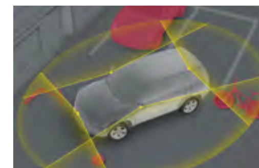
תצוגה פנורמית 360"*