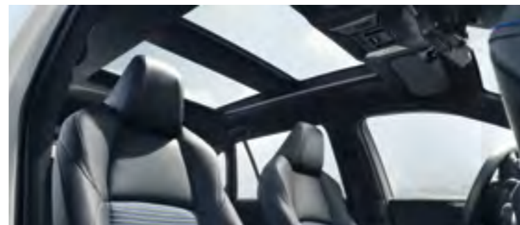
גג פנורמי (Panoramic roof)*

טכנולוגיה חכמה ומחוברת שמעוצבת לפי הדרישות והצרכים שלך