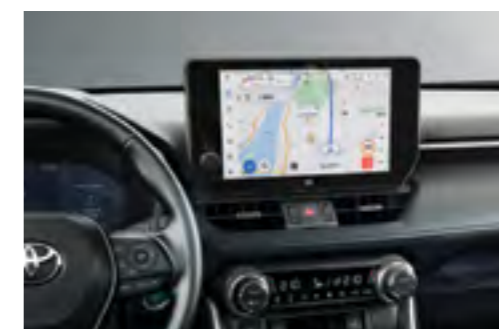
מערכת מולטימדיה 10.5" דוברת עברית