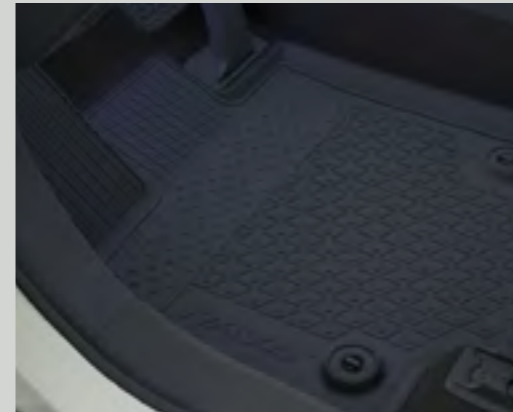
שטיחי הגומי מגנים על פנים הרכב מפני לכלוך וניתנים להסרה לניקוי קל ופשוט