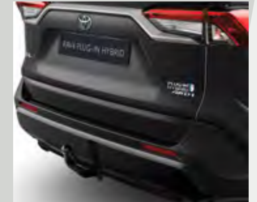
וו גרירה מקורי (לבחירתכם - קבוע או נשלף) המספק כושר גרירה גבוה ומאפשר התקנה של מתקן אופניים אחורי