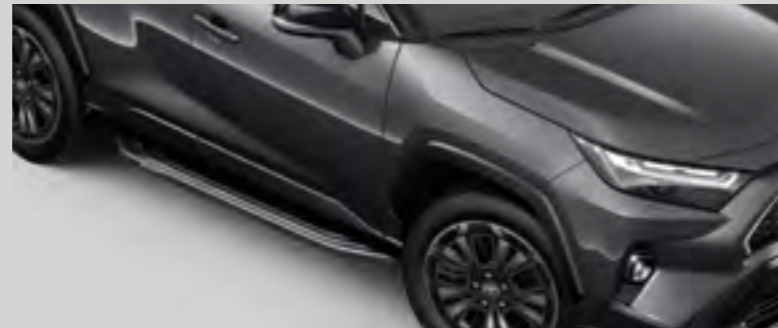
מדרגות צד המעצמות את המראה המחוספס של הרכב ומסייעות להגיע לגג הרכב בצורה קלה ופשוטה יותר