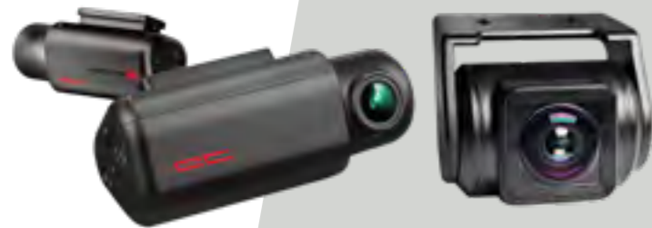
מצלמת DVR מצלמת דרך קדמית ואחורית מתעדת כל אירוע בכביש