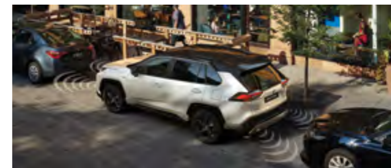
חיישני חניה אחוריים וקדמיים