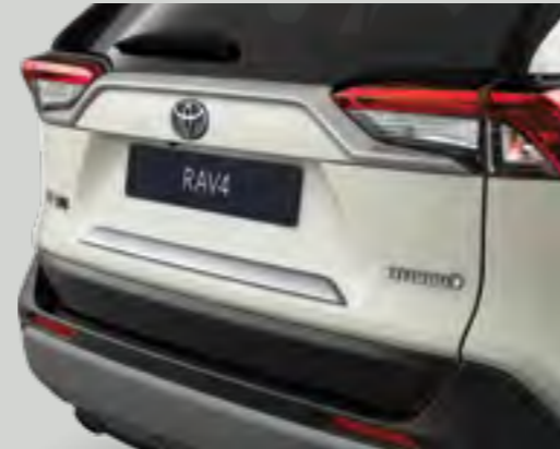
פס הקישוט מוסיף נגיעה של סטייל בחלקו האחורי של הרכב