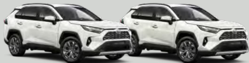
לבן צחור *040