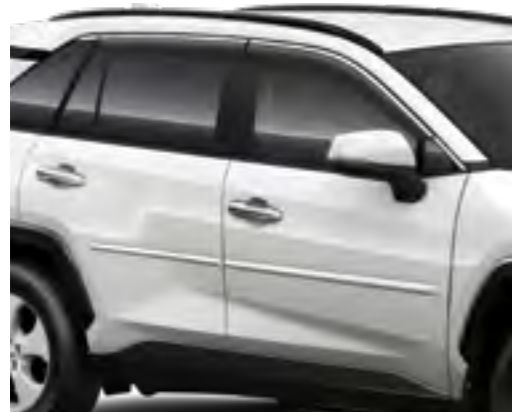
מגני רווח אידיאליים לנסיעה עם חלונות פתוחים ומותאמים באופן מדויק ואווירודינמי לצורת הרכב