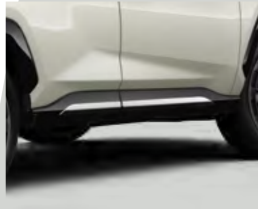
פסי קישוט מכרום לדלתות הרכב המדגישים את העיצוב והמראה הייחודי של הרכב